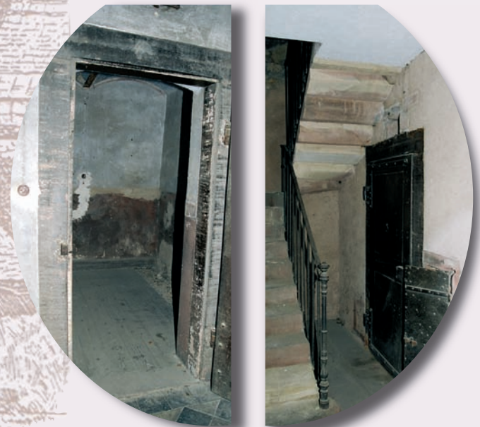
Deux cachots de l'ancien corps de garde Zwei ehemalige Kerker Two prisons of former police station