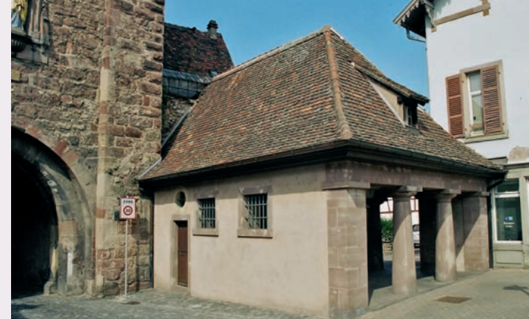
Maisonnette du XVII ème siècle ayant servi de corps de garde