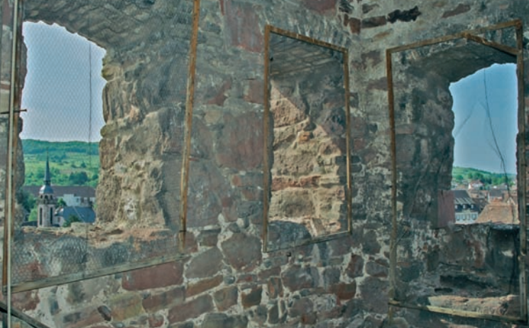
Vue sur Molsheim à travers les meurtrières Molsheim durch die Mörderinnen gesehen Seen on Molsheim through the murderesses