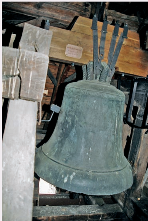
Cloche de 1412 pesant 40 quintaux Glocke von 1412, und 40 Zentner schwer Bell dating from 1412, and weighing 10 quintal