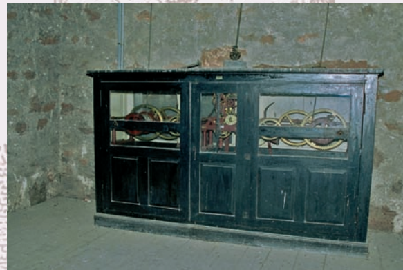
Mécanisme d'horlogerie Uhr Mechanismus Mechanism of horlogerie