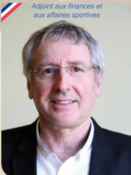
Adjoint aux finances et aux affaires sportives