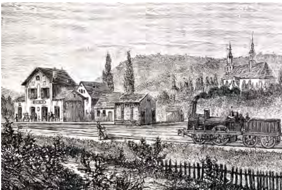
L'arrivée du chemin de fer à Molsheim, d'après une gravure publiée en 1864 dans le journal "L'illustration".

Grégory OSWALD, conservateur du Musée de la Chartreuse 4, cour des Chartreux / 67120 MOLSHEIM 03 88 49 59 38 / musee@molsheim.fr