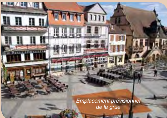
Emplacement prévisionnel de la grue

Ça y est, c'est parti ! Les travaux de réaménagement de l'aile droite de la mairie et de la création des archives dans les anciens locaux de la Coop et de l'immeuble situé dans le prolongement, rue Saint-Martin vont débiter la deuxième quinzaine de mai. Ce chantier entraînera la fermeture du parking de la mairie aux véhicules durant approximativement 12 mois.