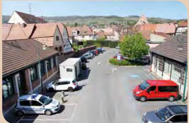
Le parking de la mairie servira de lieu de stockage et abritera notamment la base vie du chantier.

Une grue d'une embase de 6 m x 6 m sera ancrée sur la place de l'Hôtel de Ville.