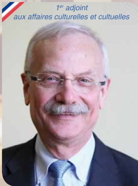
1 er adjoint aux affaires culturelles et culturelles

Laurent Furst Directeur d'hôpital en disponibilité