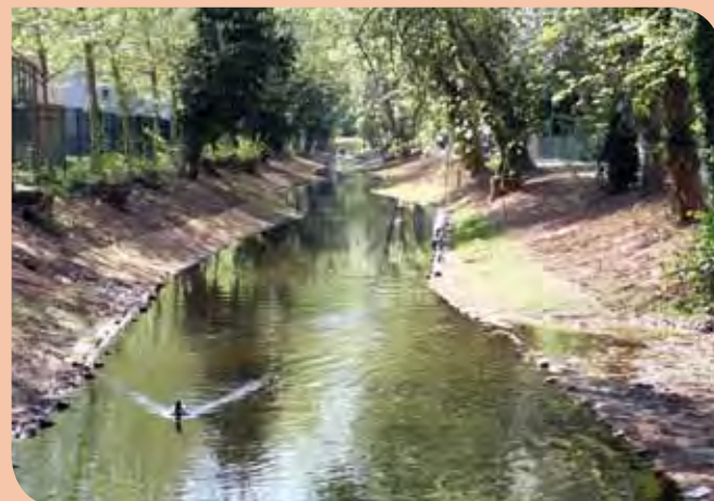
Après la phase d'enlèvement de la vase ❶ et la création de berges ❷ en fibres de coco, la Comcom privilégie l'implantation de 1 200 espèces variées pour retrouver un véritable écrin de verdure.