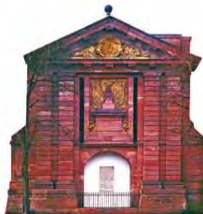
Stèle à la mémoire du siège de 1814, érigée à Sélestat... avenue Schweisguth.

Trois mois à peine après son arrivée à Sélestat, la place est investie le 5 janvier 1814.