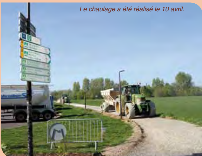
Le chaulage a été réalisé le 10 avril.

Entrepris en novembre 2013, les travaux d'aménagement de la piste cyclable située derrière le Weldom et le Super U ont connu quelques re-