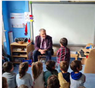
Tournée de rentrée dans les écoles