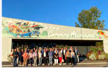
20 e anniversaire du jumelage Molsheim-Gerbrunn