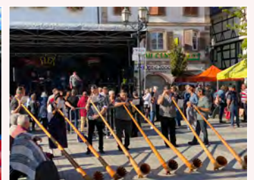
62 e Fête du raisin