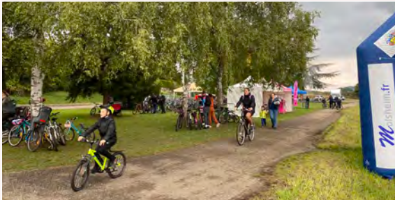
20 e Tour vélo de la Communauté de Communes