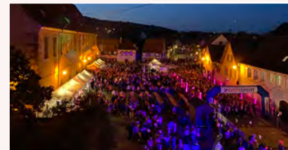
4 e édition de La Molshémienne