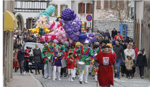
Cavalcade des enfants 25/2/2023 (Comité des Fêtes)