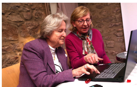
Conférence Arts & Cloître 11/3/2023