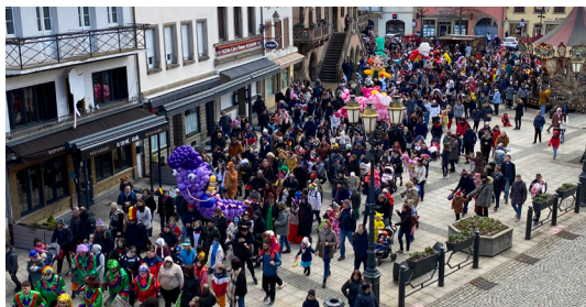
Cavalcade des enfants 25/2/2023 (Comité des Fêtes)