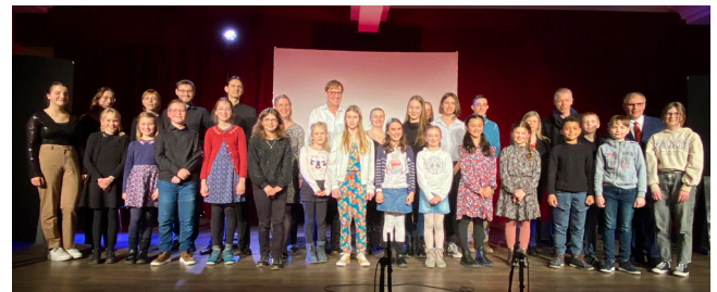
Prix Albert Hutt 5/3/2023 (EMMD)