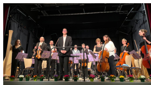
Concert de l'Orchestre Philharmonique du Cercle St Georges de Molsheim 11/3/2023