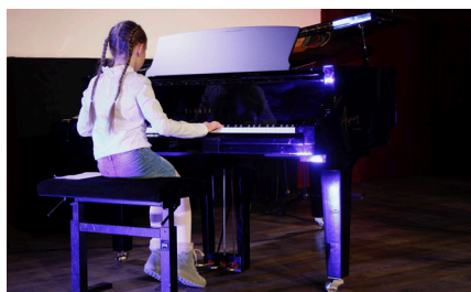
Prix Albert Hutt 5/3/2023 (EMMD)