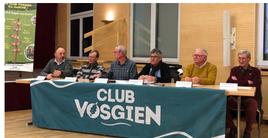
Assemblée Générale du Club Vosgien 8/3/2023