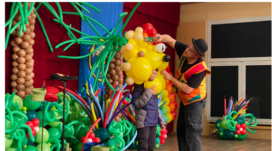
Cavalcade des enfants 25/2/2023 (Comité des Fêtes)