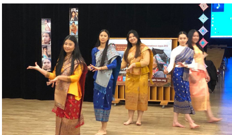
Solidarité avec le Laos 1-2/3/2023