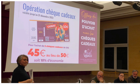
Assemblée Générale des Artisans et Commerçants de Molsheim 9/2/2023 (ASACO)