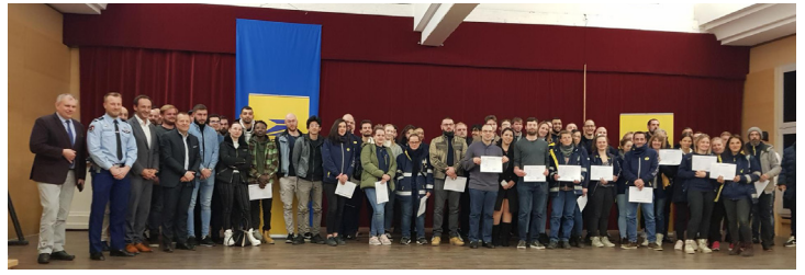
Serment des facteurs 9/2/2023