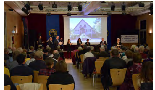
Remise des prix du fleurissement et des lumières de Noël 5/4/2023 (Ville de Molsheim)