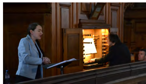
Concert des Rameaux 2/4/2023 (Amis de l'orgue Silbermann)