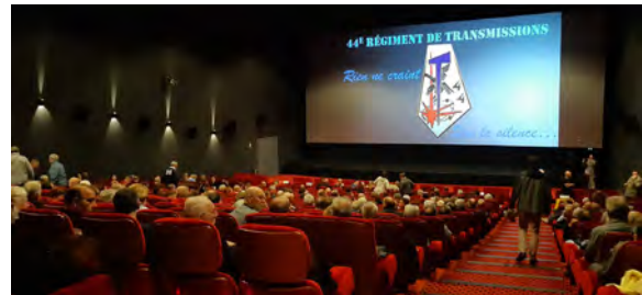
Conférence sur la guerre électronique 24/3/2023 (44° RT)