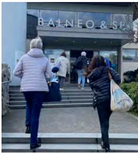
Sport senior - Marche active/rando/sortie bien-être (Service des Sports)