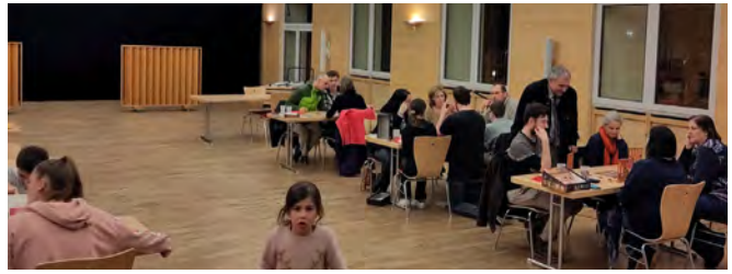
Soirée jeux 17/3/2023 (Animation Jeunes)