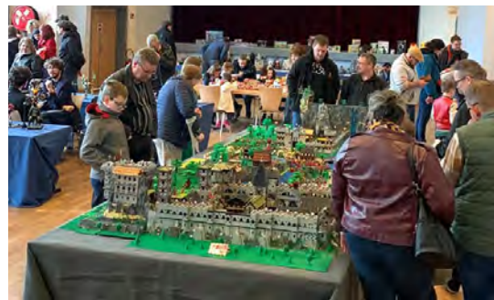
Exposition Bretz'n Brick 1-2/4/2023 (Bretzwars)