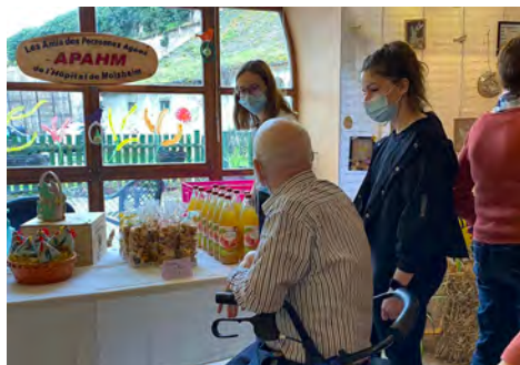
Marché de Pâques Hôpital local 1/4/2023 (APAHM)