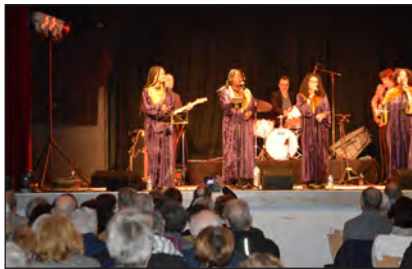
Vendredis de la Chartreuse 24/3/2023 (APAC)