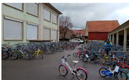
Bourse aux vélos 2/4/2023 (MVPV)