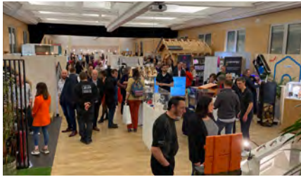
Salon du Savoir Faire 17-26/3/2023