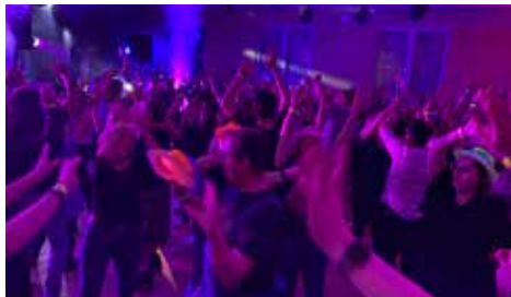
Printemps en fête, soirée années 80 15/4/2023 (Comité des fêtes)