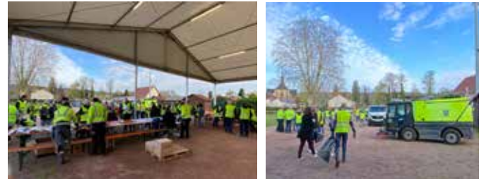
Nettoyage de printemps 15/4/2023 (Ville)