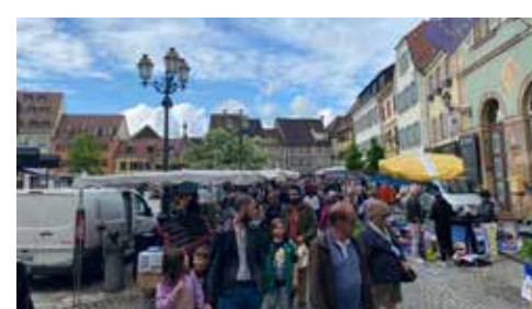
Marché aux puces 8/5/2023 (Lions Club)