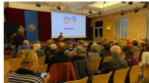
Conférence mémé part en vadrouille 20/4/2023