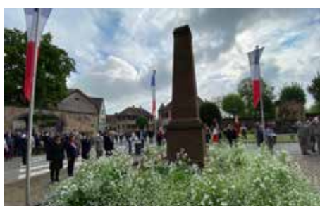
Commémoration du 8 mai