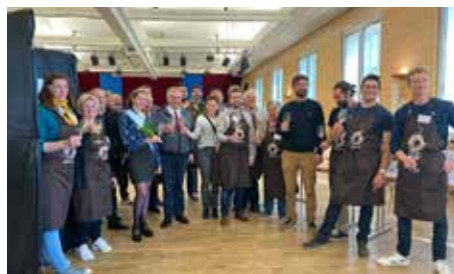
80° salon des vins 1/5/2023 (Vignerons)