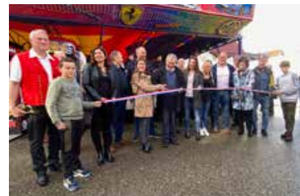
Inauguration de la foire 28/4/2023