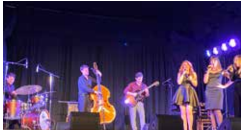
Vendredis de la Chartreuse 14/4/2023 (APAC)