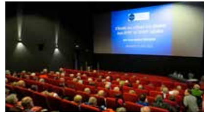
Conférence Société d'Histoire 14/4/2023