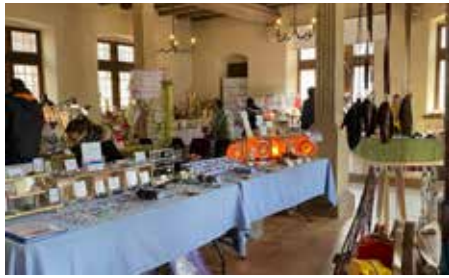
Marché de Pâques 8/4/2023 (ASACO)