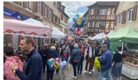
Braderie annuelle 1/5/2023