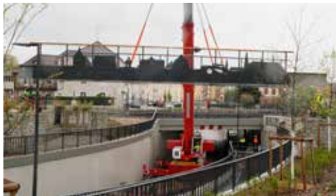
Mise en place de la passerelle cyclable 27/4/2023