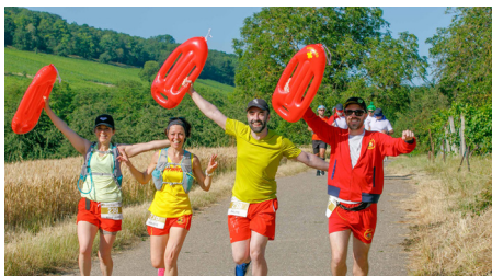
17 e Marathon du Vignoble d'Alsace - 24-25/06/2023