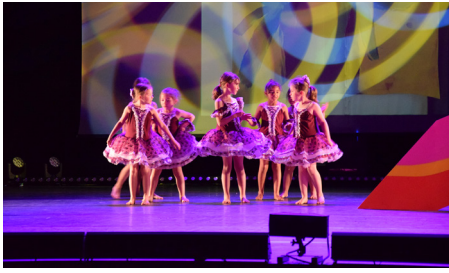
Spectacle de danse de l'Ecole de Musique Danse et Dessin 3/6/2023 - (EMMD)