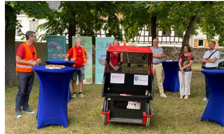
Inauguration du triporteur de l'EHPAD de Molsheim 8/6/2023 - (A vélo sans âge)