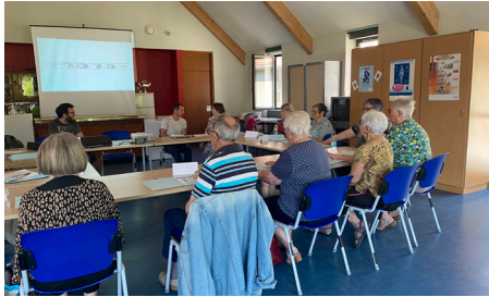
Atelier de prévention des chutes - 8/6/2023