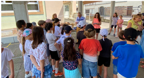
Remise des dictionnaires aux classes de CM2 - 20/6/2023 (Direction Scolaire & Périscolaire)