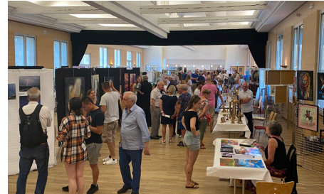
Exposition Mols'Art - 17-18/6/2023 (Ville)