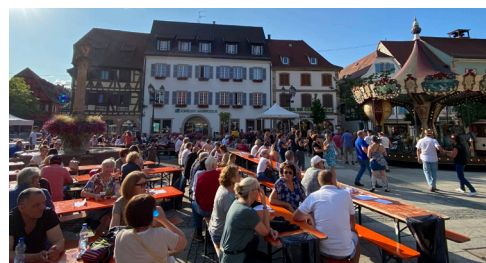
Jeudis en fête : soirée country - 6/7/2023 (ASACO)