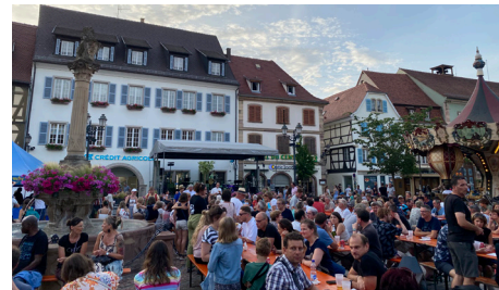
Fête de la musique - 21/06/2023