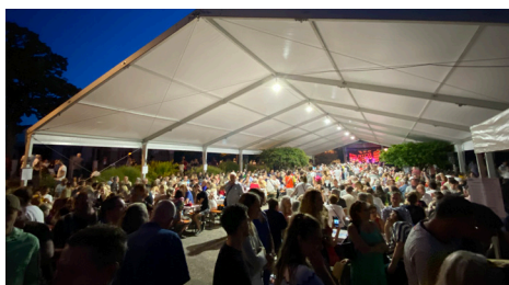
Fête Nationale - 14/7/2023 (Comité des Fêtes)