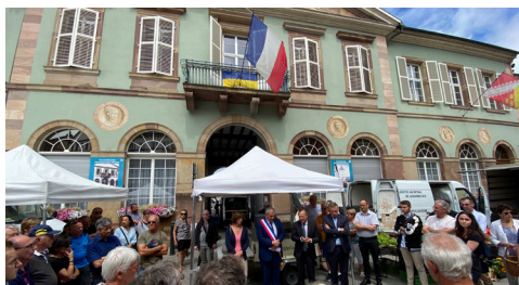
Rassemblement à l'appel de l'Association des Maires de France - 3/7/2023