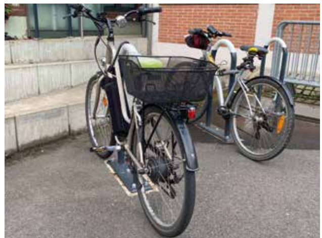
Le bâtiment de l'Hôtel de Ville dispose déjà de deux espaces dédiés au stationnement des deux roues dans la cour de la mairie.