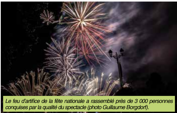
Le feu d'artifice de la fête nationale a rassemblé près de 3 000 personnes conquises par la qualité du spectacle.