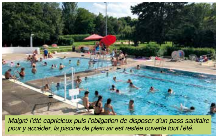
Malgré l'été capricieux puis l'obligation de disposer d'un pass sanitaire pour y accéder, la piscine de plein air est restée ouverte tout l'été.