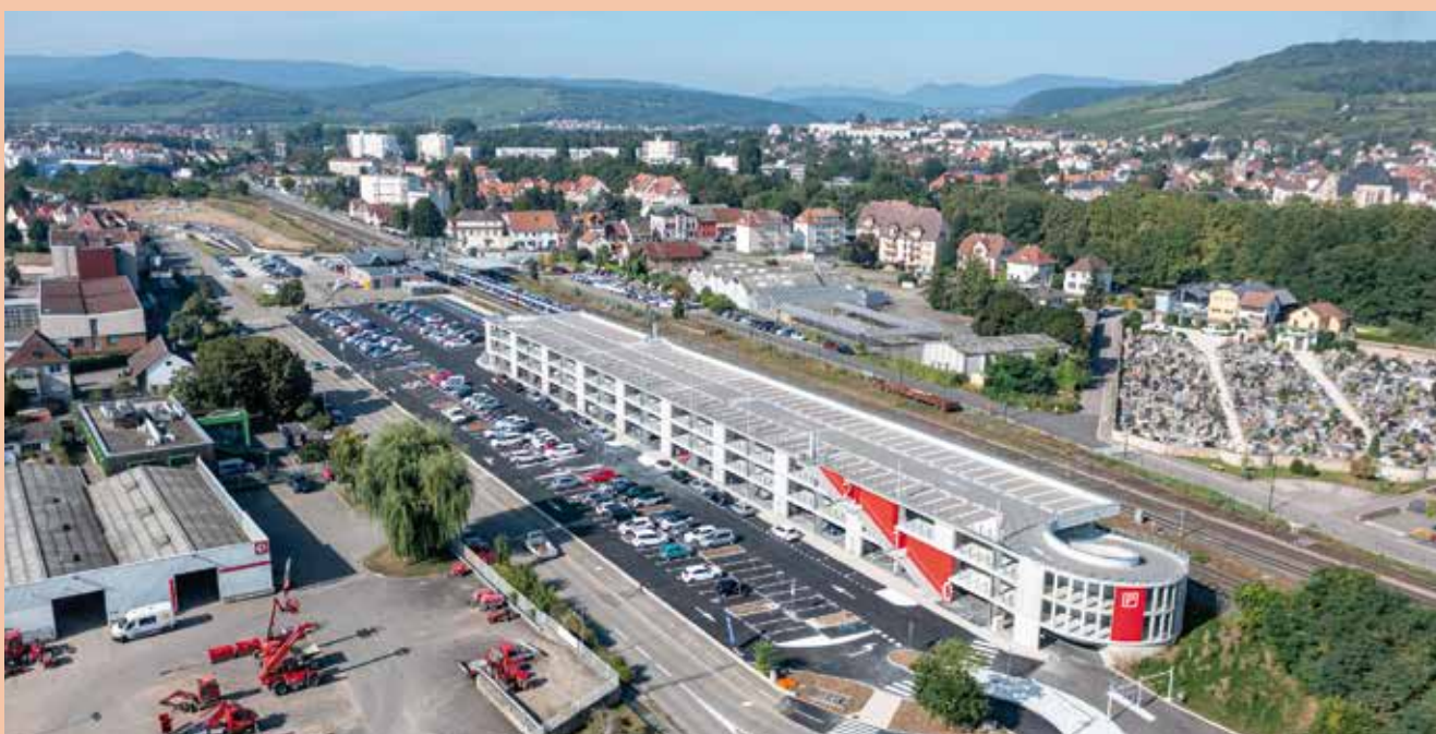
Cette vue réalisée par drone permet d'avoir une belle perspective des aménagements déjà réalisés et ceux en cours. Au premier plan le parking en ouvrage et les parkings aériens dont les enrobés ont été tirés fin août. En arrière-plan, le futur parc de la Commanderie proprement dit.