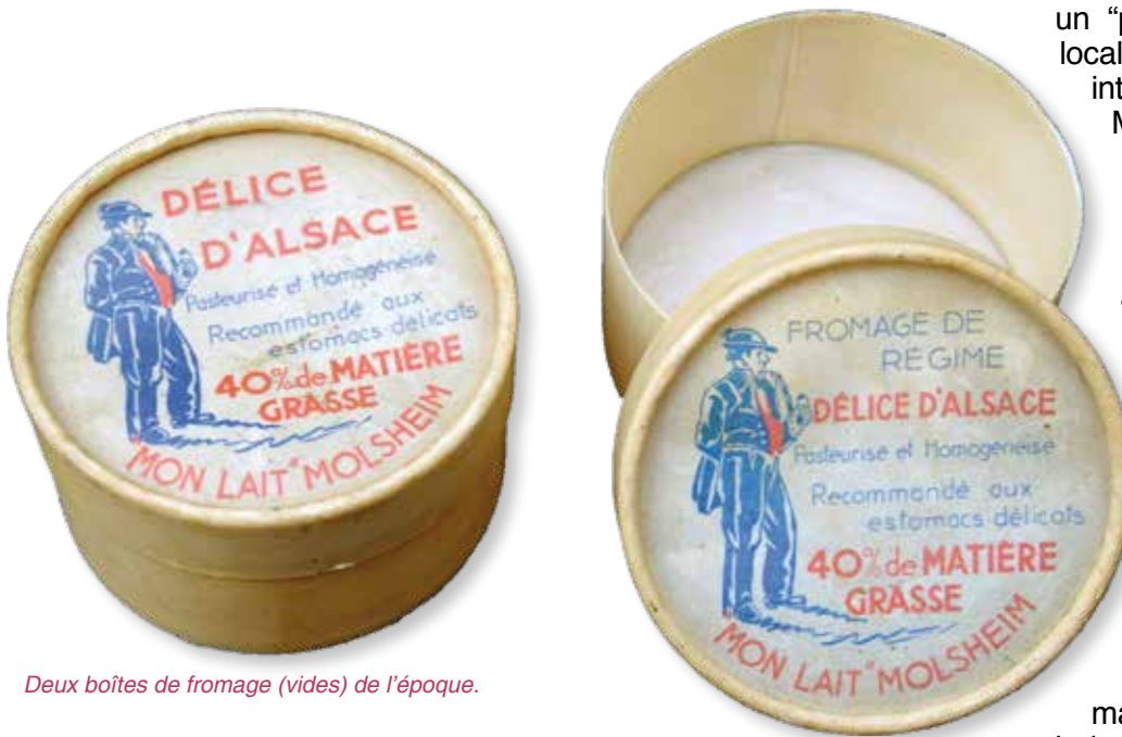
Deux boîtes de fromage (vides) de l'époque.

munster, ces derniers consistaient en camemberts et carrés de l'Est. La même année, les impératifs de restructuration devaient amener les dirigeants de la coopérative à transformer celle-ci en "Union de coopératives". En effet, les 2 500 coopérateurs individuels se répartissaient alors entre 42 coopératives locales qui devinrent ainsi membres de l'Union. Selon les rapports de l'époque, la collecte de lait et de crème atteignait le chiffre record de 40 000 litres par jour : 9 000 litres environ étaient vendus comme lait de consommation, 10 000 étaient transformés en fromages à pâte molle, 2 000 en fromages frais, 3 000 en crème fraîche, le restant en beurre. La collecte ainsi que la distribution se faisaient par les camions et le personnel de l'Union MON LAIT.