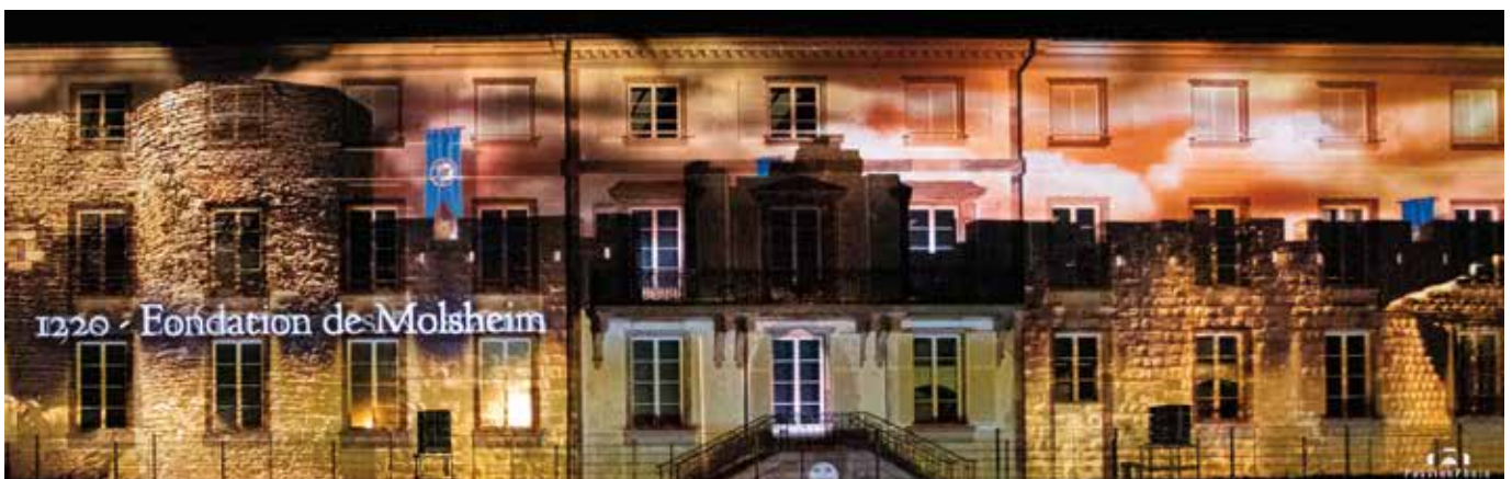
Le spectacle son et lumière projeté sur la façade de l'ancien collège des Jésuites a rassemblé près de 2 500 personnes.