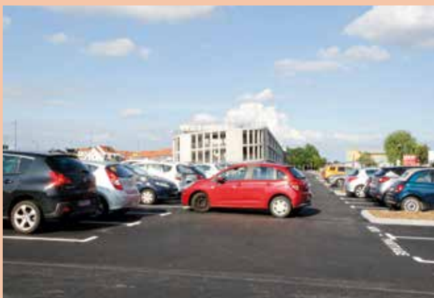
Les enrobés des parkings aériens attenants au parking en ouvrage ont été tirés fin août. Le marquage a été réalisé dans la foulée. Les mâts d'éclairage et les arbres seront implantés prochainement.

en pleine restructuration en accord avec Gares et Connexions, le propriétaire du foncier. Les travaux s'effectueront en plusieurs phases et devraient se poursuivre jusqu'au printemps 2022 avec l'installation de la passerelle cyclable qui sécurisera le franchissement de la voirie et assurera la jonction du parc au parvis.