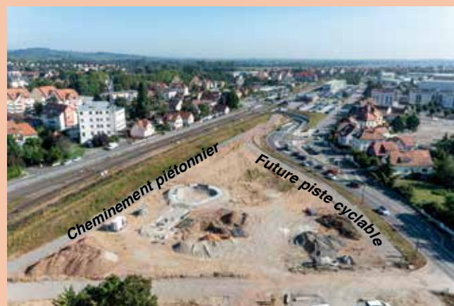
Sur cette vue réalisée par drone, on devine le futur skate-parc, le cheminement piéton côté voie ferrée et la future piste cyclable le long de la rue de la Commanderie.