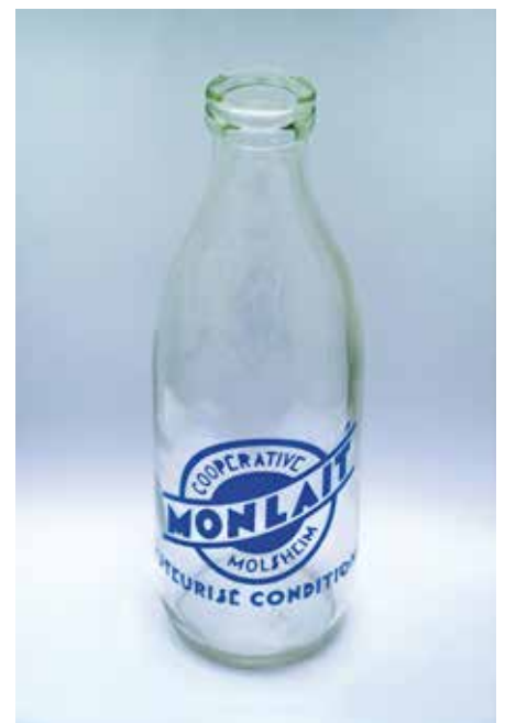
La fameuse bouteille de lait "1 litre" en verre translucide.