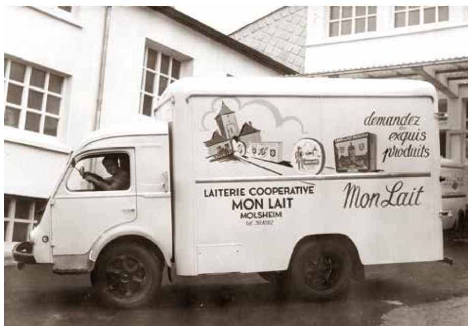
Une camionnette de la laiterie "MON LAIT", décorée par l'artiste molshémien Jean-Paul Schaeffer.

Les efforts de modernisation furent constants et toujours en rapport avec l'accroissement des rentrées journalières de lait et de crème équivalant, en 1956, à 25 000 litres par jour. En 1958, sous la présidence de Léon Kraenner, maire de Dachstein, le conseil d'administration donna son accord à la construction d'une nouvelle fromagerie, de conception plus moderne, capable de transformer quotidiennement 10 à 15 000 litres de lait en fromages à pâte molle. Outre le