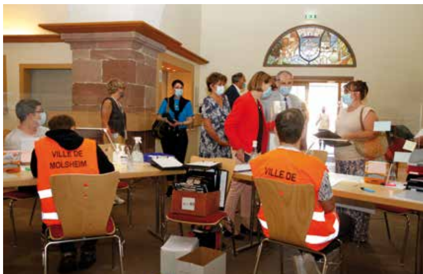
Mercredi 28 juillet, Josiane Chevalier, préfète du Bas-Rhin et de la Région est venue visiter le centre de vaccination situé à l'Hôtel de la Monnaie à Molsheim.