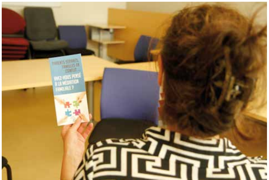
Les permanences de médiation familiale se déroulent tous les vendredis à la mairie de Molsheim. Pour en bénéficier, il est impératif de prendre rendez-vous (lire notre encadré).

D'une durée d'une heure environ, le premier entretien d'information permet aux personnes concernées de savoir si la médiation familiale peut répondre à leur situation. Le médiateur en présente le