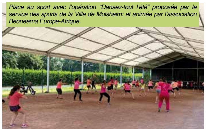
Place au sport avec l'opération "Dansez-tout l'été" proposée par le service des sports de la Ville de Molsheim: et animée par l'association Beoneema Europe-Afrique.