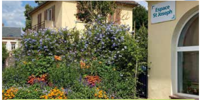
Le plumbago produit une multitude de panicules aux fleurettes à cinq pétales. Généralement bleu ciel, la dentelaire du Cap peut atteindre jusqu'à 5 m de hauteur et se plaît à être exposée plein Sud.