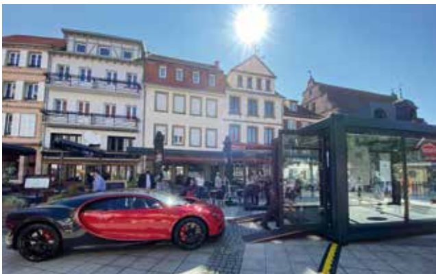
Le cube qui abrite la Chiron Sport est arrivé le jeudi 2 septembre peu de temps avant le bolide.

Que l'on soit fan ou pas de voiture, il est impossible de rester insensible au charme de la Chiron Sport présentée dans son écrin de verre sur la place de l'Hôtel de Ville. Ce modèle rouge et carbone a été dévoilé au Salon de l'automobile à Genève en 2018. Utilisée dans un but commercial pour permettre aux futurs clients de la tester elle combine à la fois sportivité et confort. Visuellement, la Chiron Sport se distingue par des jantes spécifiques et quatre sorties d'échappement rondes. Avec ses 1500 chevaux, elle peut atteindre une vitesse de pointe limitée à 420 km/h. La Ville de Molsheim remercie l'entreprise Bugatti pour la mise à disposition gratuite de ce bijou qui sera présent jusqu'au vendredi 29 octobre.