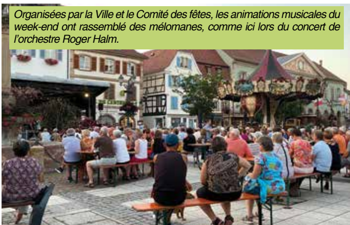
Organisées par la Ville et le Comité des fêtes, les animations musicales du week-end ont rassemblé des mélomanes, comme ici lors du concert de l'orchestre Roger Halm.