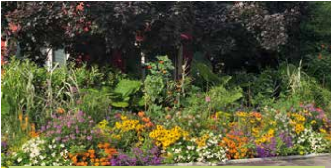
L'équipe Espaces verts s'est une fois de plus surpassée en proposant des massifs aux espèces chatoyantes et flamboyantes comme l'alstroèmère, l'œillet d'inde, la verveine ou encore l'echebeckia.