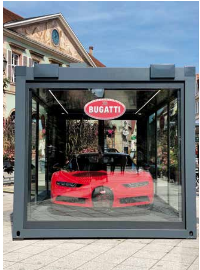
Sur la calandre en forme de fer à cheval, les plus avertis pourront découvrir le nombre 16 décliné en rouge, 16 comme le nombre de cylindres de son moteur en W.