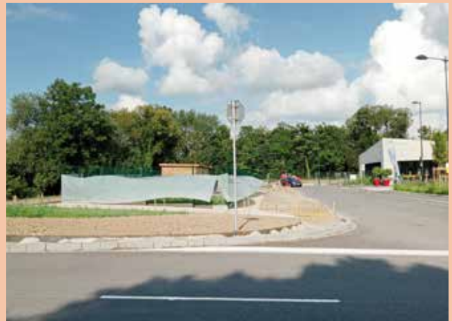
Durant le coulage du béton, les clôtures de la poulerie ont été bâchées pour éviter toute salissure du grillage.

Quant à l'arrivée des poules d'Alsace, les spécialistes prévoient de réaliser deux à trois tontes d'herbe avant leur installation définitive.